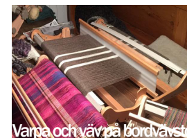
Varpa och väv på bordsvävstol