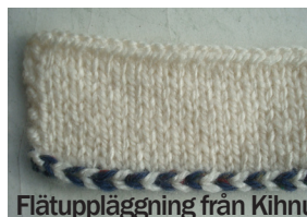
Flätuppläggnig från Kihnu