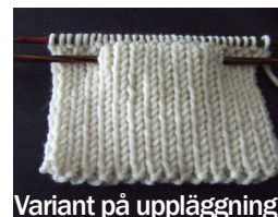
Variant på uppläggnig