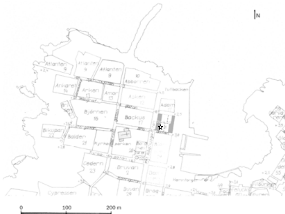
Figur 1. Översiktsplan över Öregrund med platsen för den arkeologiska schaktningsövervakningen utmärkt med stjärna. Dagens bebyggelse i kvarteret har gråmarkerats.

Bergvärmeinstallationerna berörde två fastigheter, Öregrund 18:2 och 18:4. Enligt de försök som gjorts att rekonstruera strandlinjen skulle denna i stadens äldsta skede ha gått genom kvarteret Båten, ungefär mellan de berörda fastigheterna (Söderberg 1985). Den arkeologiska övervakningen genomfördes endast vid schaktningarna inom Öregrund 18:2 som antagits ligga över den medeltida vattenlinjen.