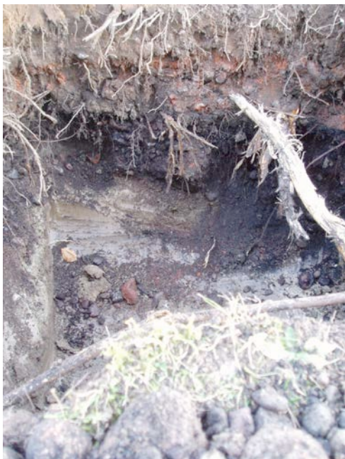
Figur 5. Foto av sektionen.