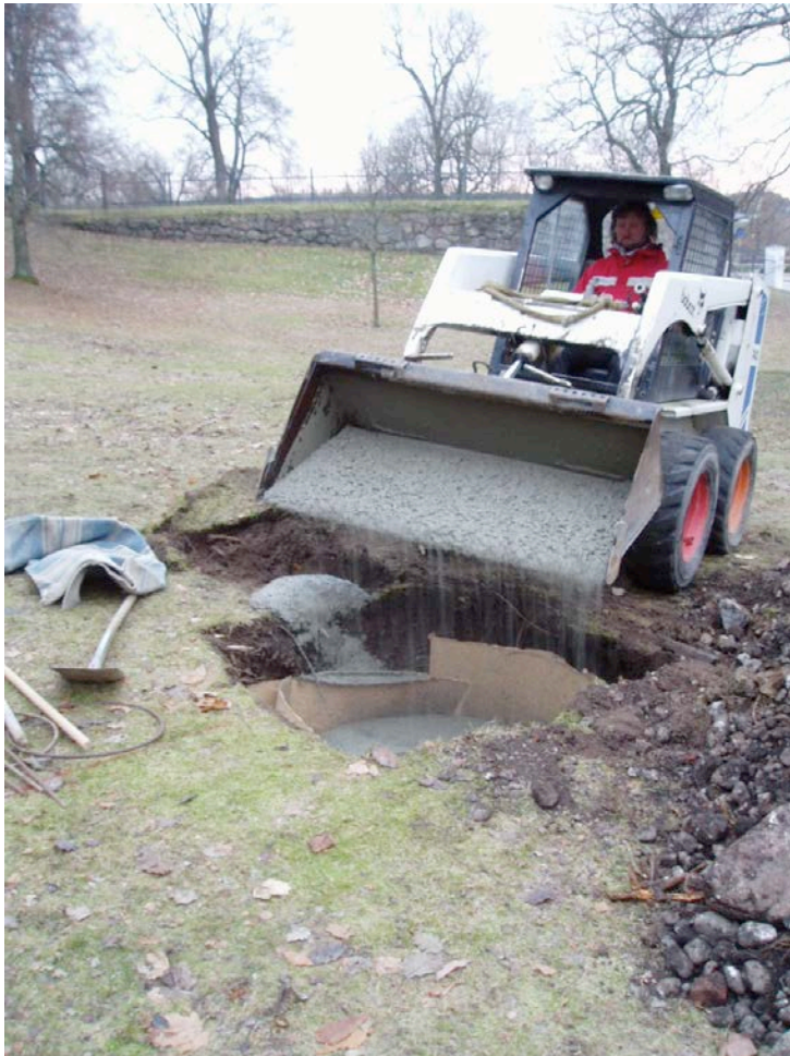
Figur 7. Gropen fylls med betong innan sockeln sätt på plats.

Denna lagerföljd visar att platsen för bystens uppsättande inte uppvisar spår av medeltida eller historiska lämningar. Lager 2 som innehåller tegelfragment kan dock vara rester efter slottets uppförande eller olika ombyggnationer som skett sedan dess. Några spår efter äldre aktiviteter, såsom förhistoriska gravar fanns inte.