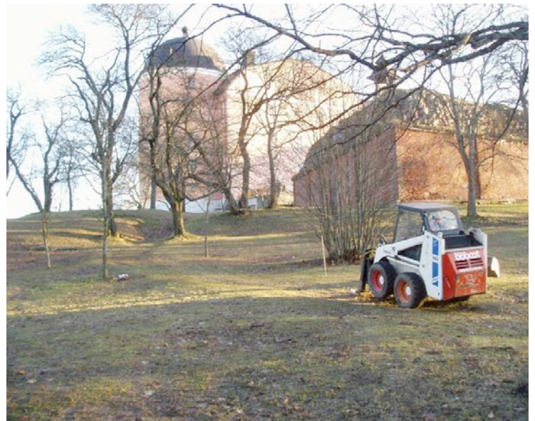
Figur 3. Platsen för bysten (käpp) innan schaktning för fundament påbörjats. Sett mot slottet.