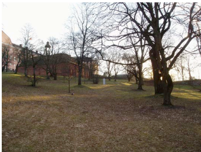
Figur 9. Som ovan, men från längre håll.