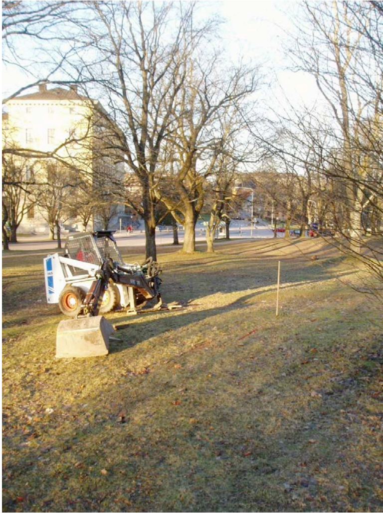
Figur 2. Platsen för bysten (käpp) innan schaktning för fundament påbörjats. Sett ner mot Carolina.