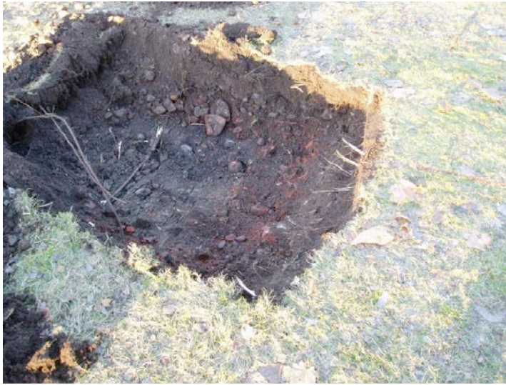
Figur 6. Gropen med lager 2 synligt i toppen.

Denna lagerföljd visar att platsen för bystens uppsättande inte uppvisar spår av medeltida eller historiska lämningar. Lager 2 som innehåller tegelfragment kan dock vara rester efter slottets uppförande eller olika ombyggnationer som skett sedan dess. Några spår efter äldre aktiviteter, såsom förhistoriska gravar fanns inte.