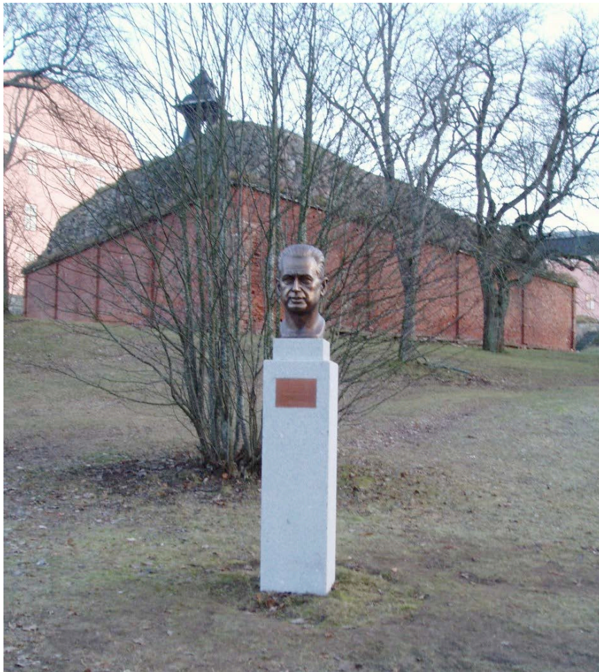
Figur 10. Bysten av Dag Hammarskjöld uppsatt och klar.

I samband med grundläggning och placering av en byst av Dag Hammarskjöld har Upplandsmuseet utfört en arkeologisk schaktningsövervakning och antikvarisk kontroll. Resultatet av arkeologin visade att inga äldre medeltida lager eller konstruktioner funnits på den schaktade ytan. Den antikvariska kontrollen utfördes eftersom ingreppet skedde inom statligt byggnadsminne. Här har uppförandet följt de anvisningar som angavs i tillståndet.