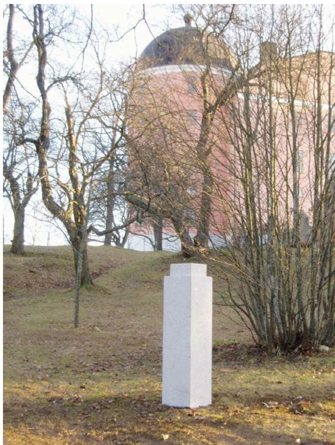
Figur 8. Sockeln färdigmonterad på platsen. Sett mot slottet.

Bystens uppförande och placering följer de intentioner som avsågs i ansökan till Riksantikvarieämbetet. Någon avvikelse har inte skett i förhållande till ansökan och Riksantikvarieämbetets synpunkter. Upplandsmuseet anser att placeringen inte har påverkat Uppsala slotts kulturhistoriska värde.